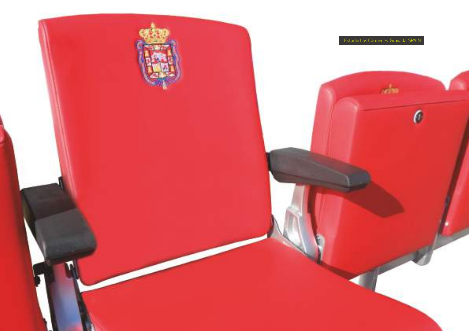
Estadio Los Cármenes, Granada, SPAIN