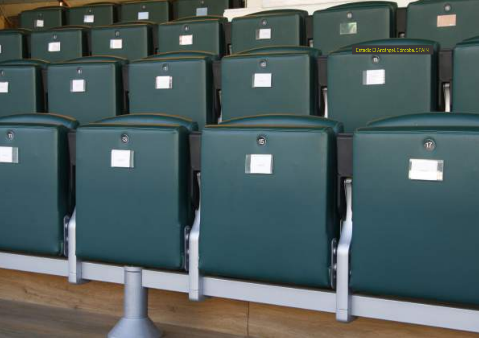
Estadio El Arcángel, Córdoba, SPAIN